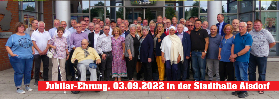
Jubiläum-Ehrung, 03.09.2022 in der Stadthalle Alsdorf