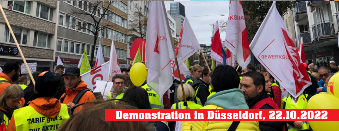
Demonstration in Düsseldorf, 22.10.2022