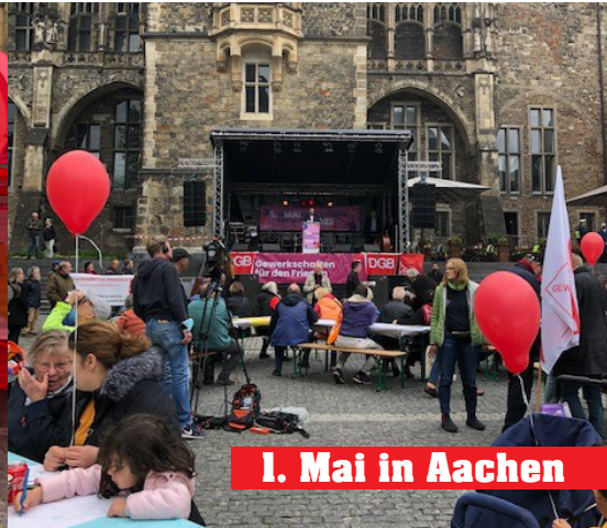
1. Mai in Aachen